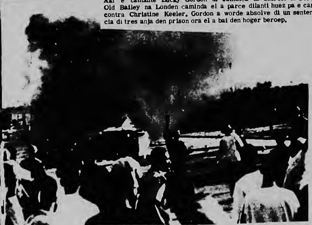
Un bista di e eleccionnan na Senegal durante cual 11 hende a perde nan bida. Riba e portret un multitud ta rondona un jeep cu nan a pega na candela.